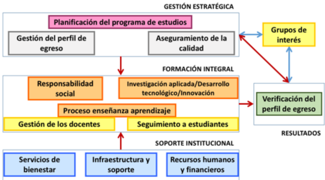
Figura 4: Relación de dimensiones y factores del modelo de acreditación de programas de estudios